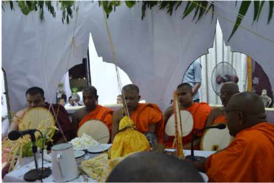
කොළඹ බන්ධනාගාර සංකීර්ණයේ ගෘහස්ථ බන්ධනාගාර බැඳීමේදී ජ්‍යෙෂ්ඨ නිලධාරීන් විවෘත කිරීම